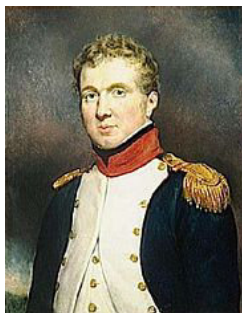
Claude-Victor Perrin, lieutenant-colonel du 5 e bataillon du Rhône en 1792, Georges Rouget , 1835.

Il fait partie de la Garde nationale de cette ville comme grenadier et le 21 février 1792 , il est nommé adjudant du 3 e bataillon des volontaires de la Drôme . Il y sert jusqu'au 4 août , quand il est promu au grade d'adjudant-major capitaine dans le 5 e bataillon des Bouches-du-Rhône .