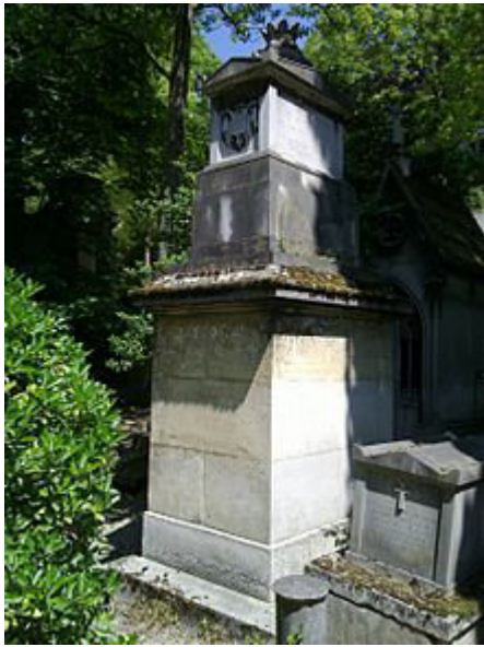
Tombe au cimetière du Père-Lachaise

Le 8 juillet 1815 , Victor revient à Paris, avec Louis XVIII . Le 8 septembre , il est nommé major-général de la Garde royale (commandement en alternance avec Macdonald, Oudinot et Marmont), puis le 17 août , Pair de France .