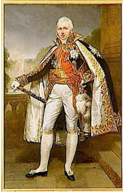
Claude-Victor Perrin, duc de Bellune, maréchal de France, Antoine-Jean Gros, 1812 .

Le 6 juin , Victor remplace Bernadotte , blessé dans une escarmouche, à la tête du I er corps d'armée. 8 jours plus tard, le 14 juin 1807 , il est à Friedland , où il dirige victorieusement la charge contre le centre russe. Il est fait maréchal d'Empire le 13 juillet 1807 (19 e dans l'ordre).